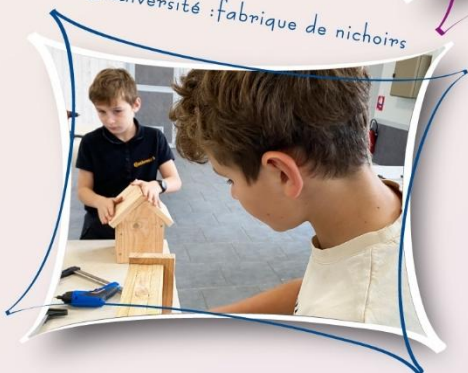
Biodiversité : fabrique de nichoirs