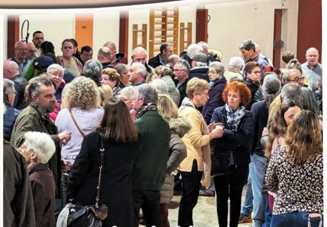
Moment de convivialité où les petits fours accompagnent le cocktail du nouvel an