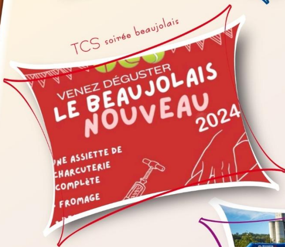
TCS soirée beaujolais