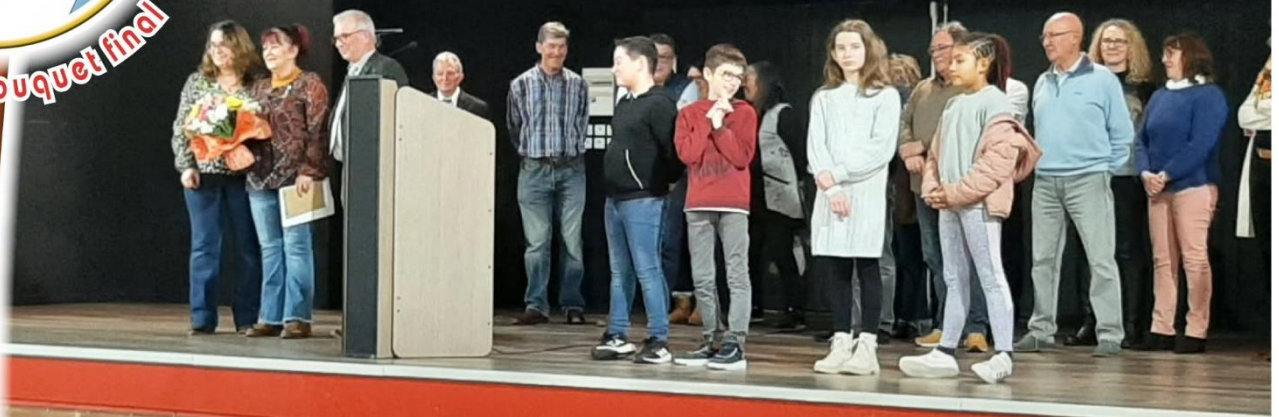
Cliché pour immortaliser ce moment en présence du "Conseil Municipal Jeunes"