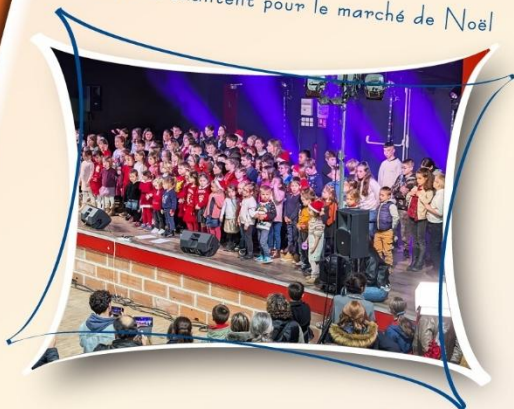
Les enfants chantent pour le marché de Noël