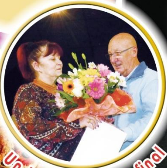
Un beau bouquet final