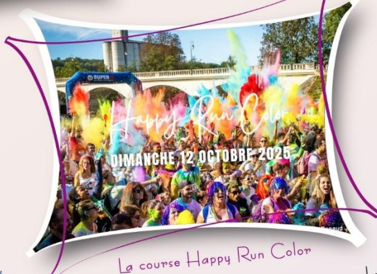
La course Happy Run Color