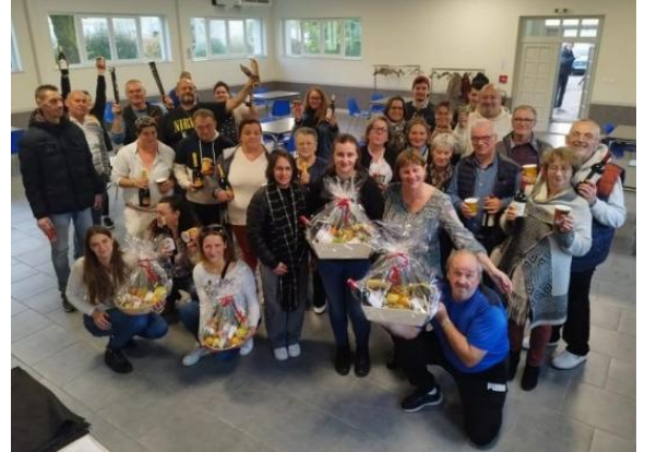
Tournoi de belote : Remise des récompenses

Les entraînements se déroulent à la salle des Tanneries, le mercredi soir et le dimanche après-midi.