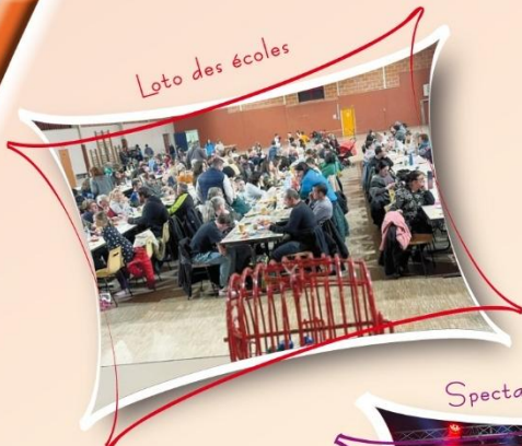
Loto des écoles