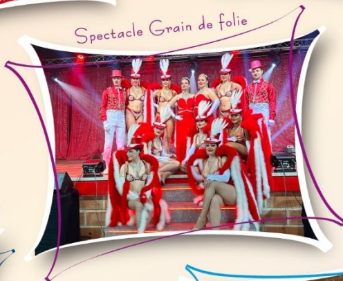
Spectacle Grain de folie