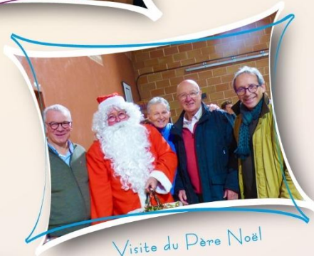
Visite du Père Noël